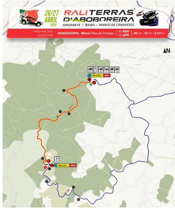
Imagem 2: Aboboreira: Freguesia de Várzea, Aliviada e Folhada